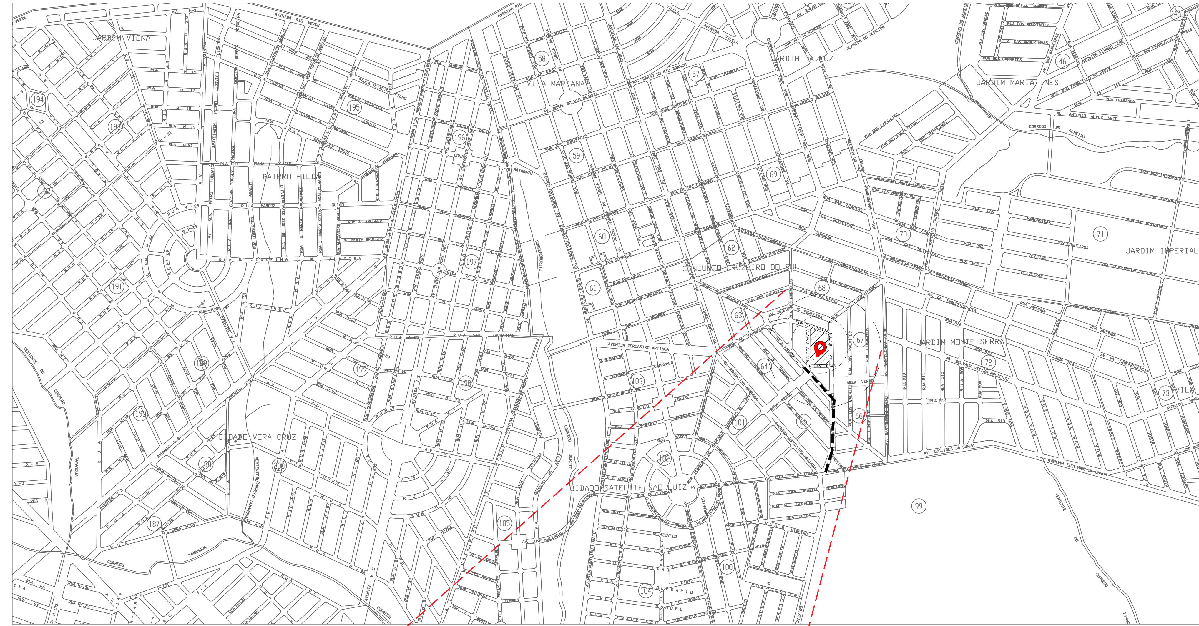
PLANTA DE SITUAÇÃO